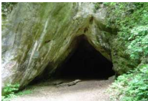
A Kecske-lyuk barlang bejárata