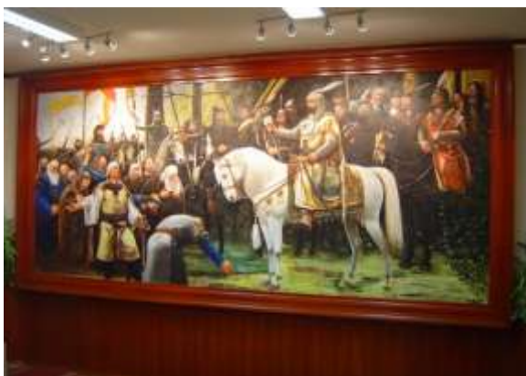
Kárpáti tanár úr festménye