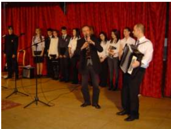
Először nálunk a Szamadó-zenekar

Újszerű kezdeményezés volt, hogy a március 15-i, illetve a ballagási műsoron részt vettek a Központi Leánykollégium diákjai is, akik elmondásuk szerint máskor is szívesen szerepelnének hasonló rendezvényeken. S. D. (105)