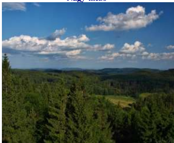
Kilátás a Bálványon levő Petőfi-kilátóról