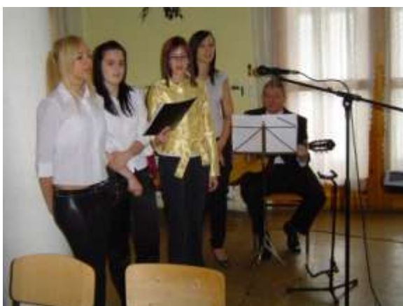
Ballagási műsor lányokkal